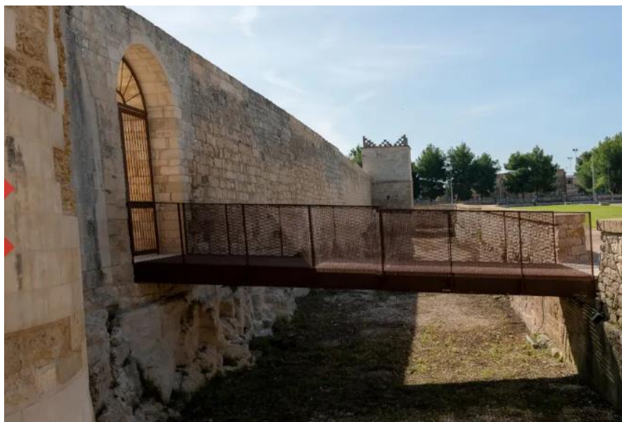
Salento, Melpignano, ponte con fossato