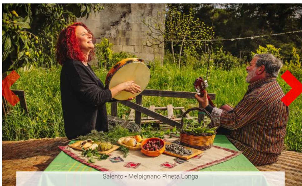
Salento - Melpignano Pineta Longa