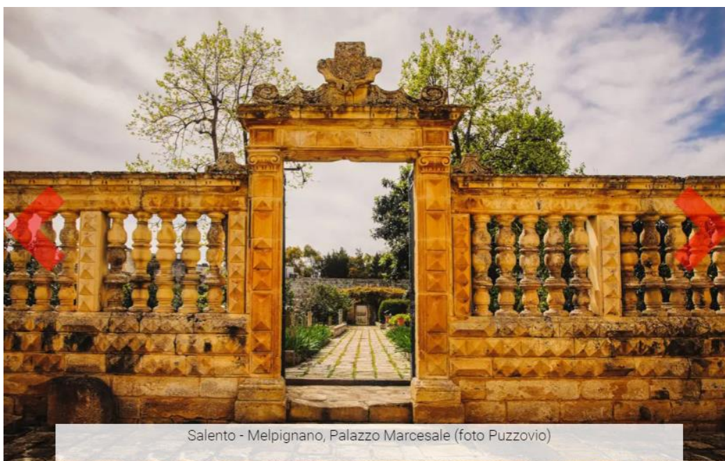
Salento - Melpignano, Palazzo Marcesale