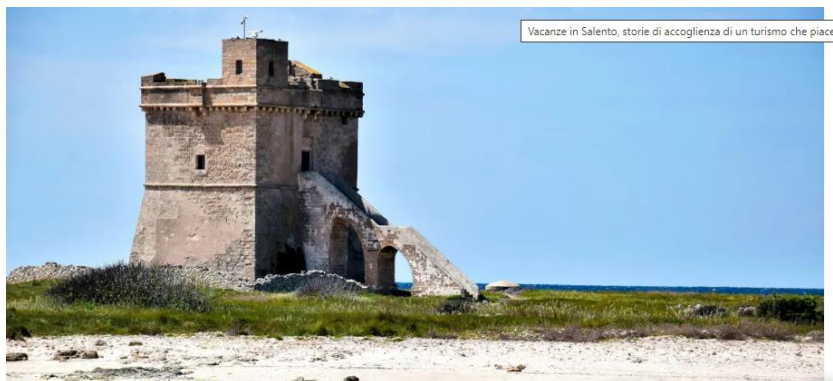
Il Salento è ricco di storie di accoglienza

Il Salento è ancora una terra di accoglienza? Negli ultimi giorni non si fa altro che leggere notizie allarmanti su fughe di turisti e pugliesi scontenti e prezzi alle stelle ovunque , si fanno confronti con destinazioni come l'Albania e la Grecia più competitive della Puglia e ci si dimentica totalmente delle realtà virtuose, che pure in Puglia esistono, ma non fanno notizia.